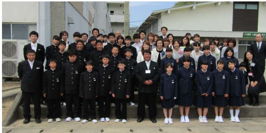
入学式後の集合写真：保護者の皆様と一緒に

労をいとわず、作業に積極的に取り組む態度には目を見張るものがあります。係・当番の仕事や掃除等に、責任をもって自主的・積極的に取り組んでいる姿勢は素晴らしいです。例えば先日、各列の机・椅子をまっすぐに並べるために、ペアで教室の前後に立ち、「その机をもっと左、もう少し右・・・」と、声をかけあって作業をしているほほえましい光景を目にしました。協力して活動すると、掃除も楽しいし、教室もますますきれいになって、気持ちがいいですね。