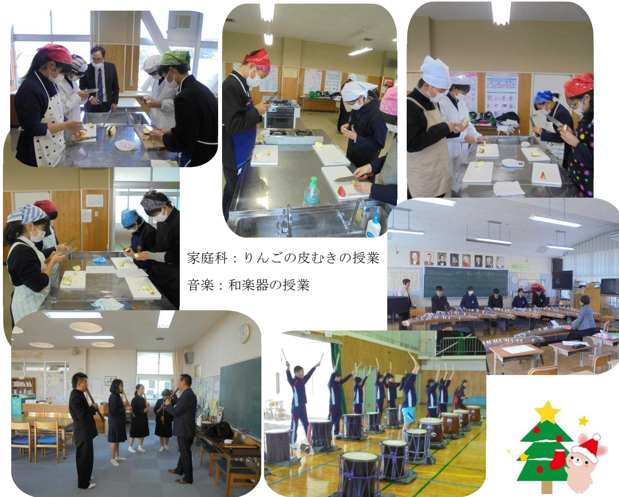
家庭科：りんごの皮むきの授業