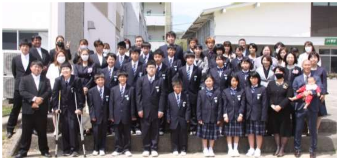
入学式後の集合写真：保護者の皆様と一緒に

労をいとわず、作業に積極的に取り組む態度には目を見張るものがあります。係・当番の仕事や掃除等に、責任をもって自主的・積極的に取り組んでいる姿勢は素晴らしいです。「学校が楽しい!」という声がよく聞かれます。仲間と協力して活動すると、ますます充実した学校生活になります。