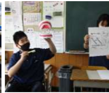
保健委員による歯磨き指導