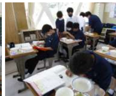
給食後の自主勉強