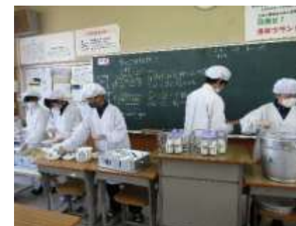
スムーズな給食配膳

給食前は、給食係の衛生点検に始まり、日直が教室の机や配膳台を拭き、給食当番が配膳室へ給食を取りに行き配膳する等、たくさんの仕事があります。これらの一連の活動がたいへん速やかにできるようになりました。困っている仲間がいると自然にサポートする姿もすばらしいです。給食後はすぐにノートや教科書を開いて自主的に勉強したり読書したりする人も多く、時間を有効に活用できています。また、保健委員による歯磨き指導後は、給食後の歯磨きも始まりま